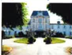
411 Grande Rue 74930 REIGNIER