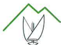
Hopitaux du Léman