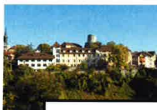
Hôpital Local Andrevetan